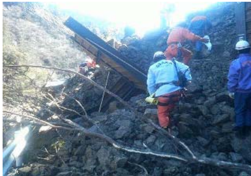
土砂崩れ現場で救助活動をする緊急消防援助隊