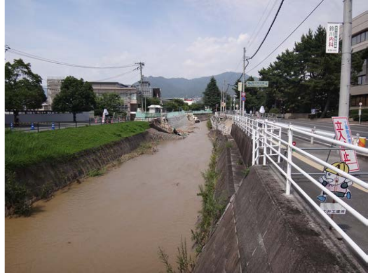
榎川護岸潜屈箇所上流側