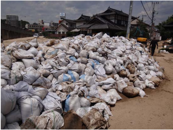
家屋、道路に堆積した泥を入れた土嚢