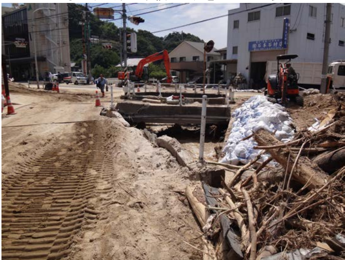
河川に堆積した瓦礫、破壊された護岸