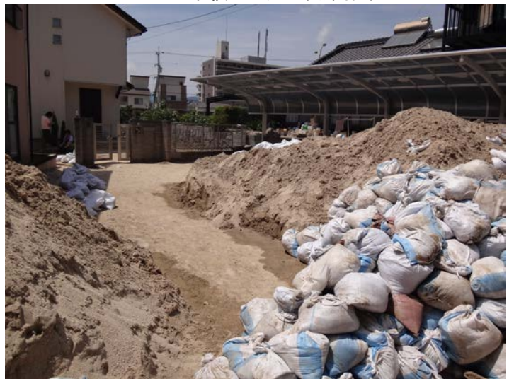
家の前まで道路上の堆積した土砂を除けた状態