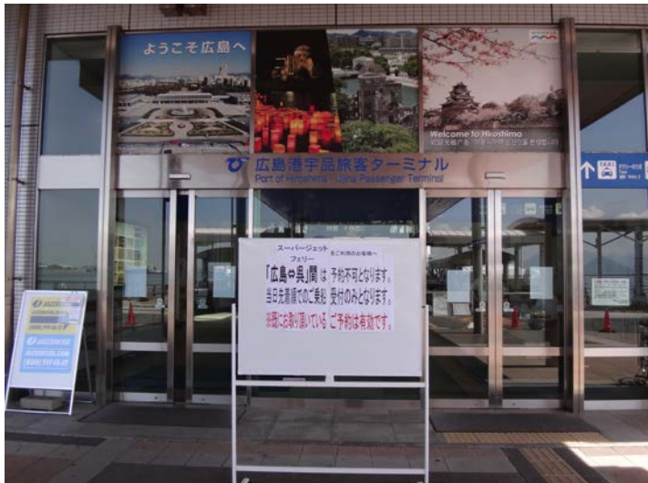
旅客ターミナル入り口