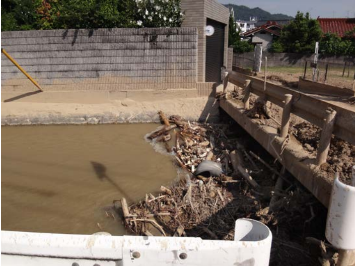
橋梁に堰き止められた瓦礫