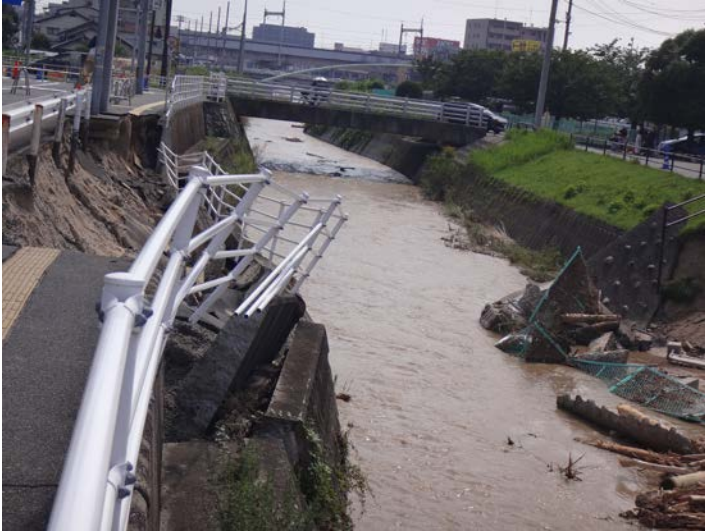
榎川護岸潜屈箇所下流側