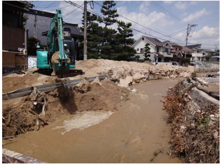
河川に堆積した泥の浚渫作業