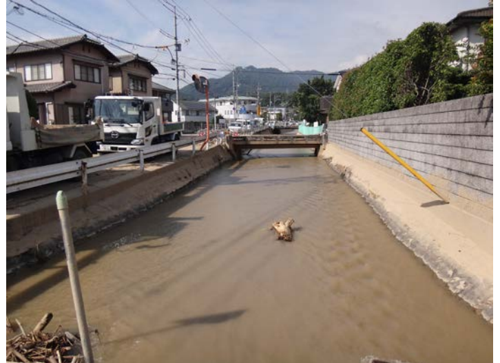
土砂が堆積して川底が2m近く上がった現状