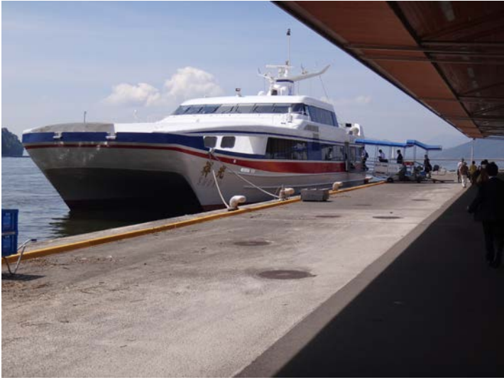
呉・松山行きスーパージェット