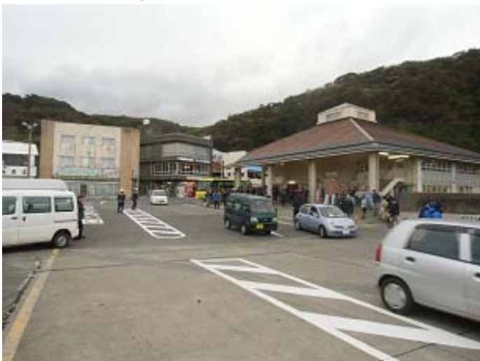
岡田港の乗船場及び駐車場