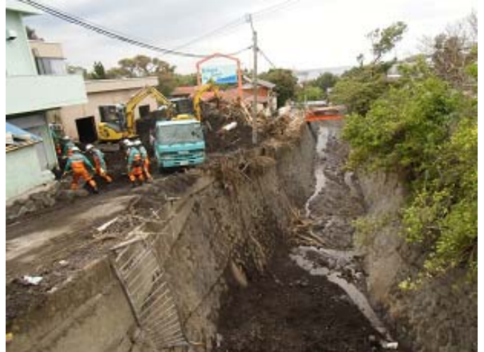
都道 208 号からの大金沢流路の状況