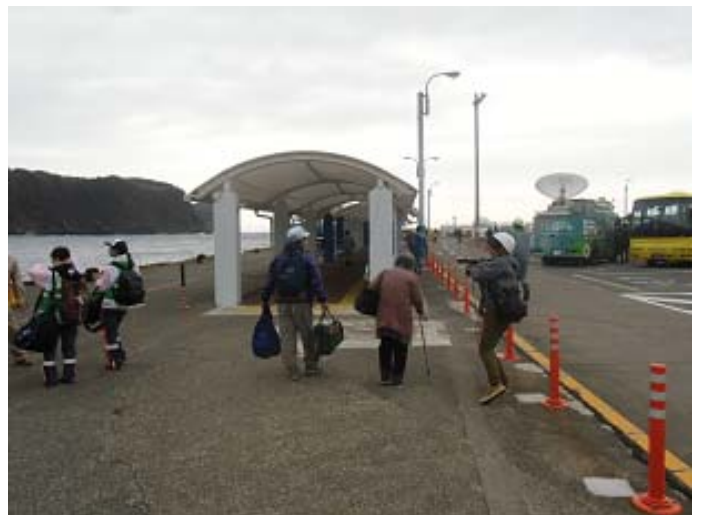
島外に避難する方が乗船する様子