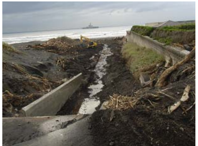
海側の土砂の状況(海側でも捜索活動を実施)