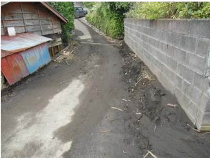
通り沿いに残る土砂