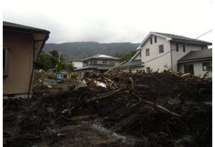
住宅街への土砂の流入