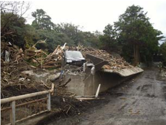
車と塀が破壊された様子