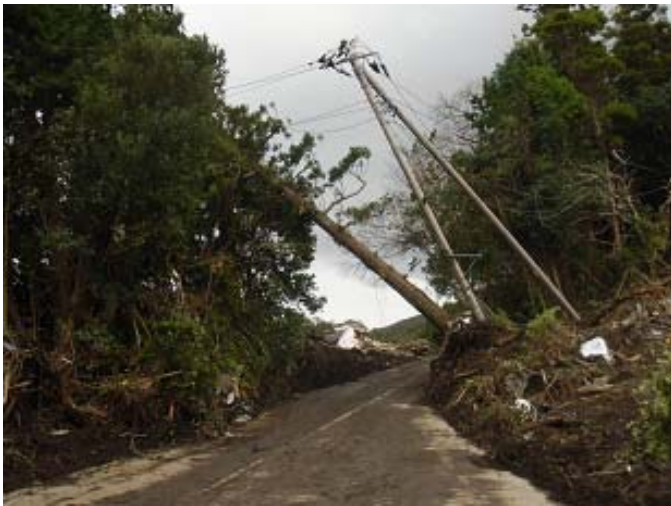
電柱や樹木が傾いている様子