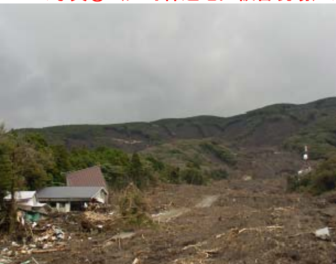
土石流現場の山肌