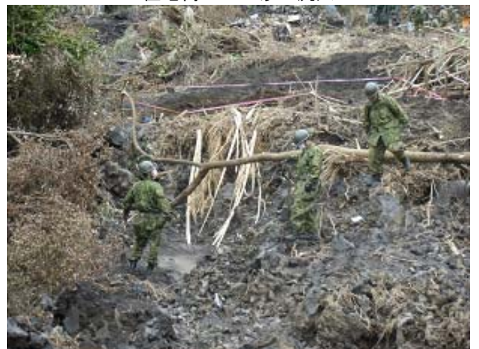
自衛隊による搜索活動