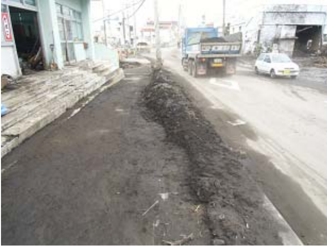
都道 208 号(町役場前道路)の状況 (役場から 100m 程度離れた所)