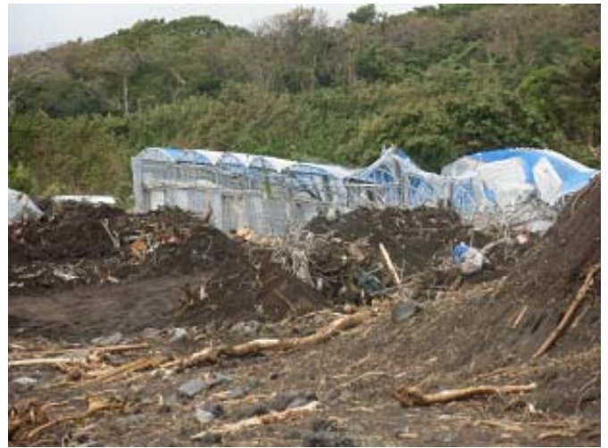
ビニールハウスが破壊された様子