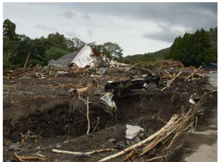
家屋や車が破壊された様子