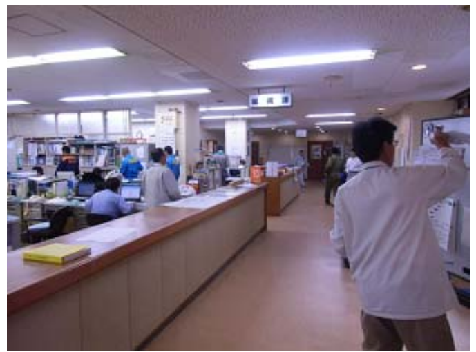
役場職員の執務状況(2階総務課付近)