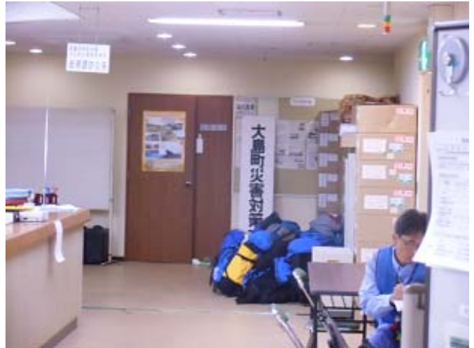
災害対策本部室(2階総務課の奥)