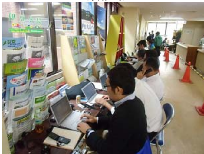
マスコミ関係者(2階総務課カウンターの向かい)