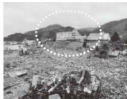
【震災後の女川町立病院】