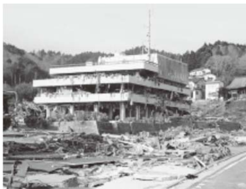
被災後の役場庁舎