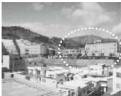
【震災前の女川町立病院】