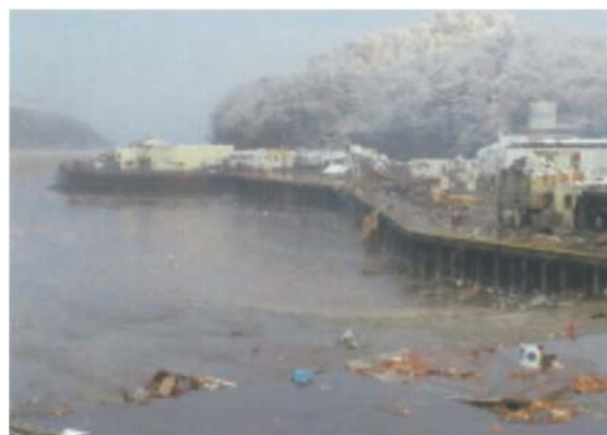
湾内の海水がすべて消えた