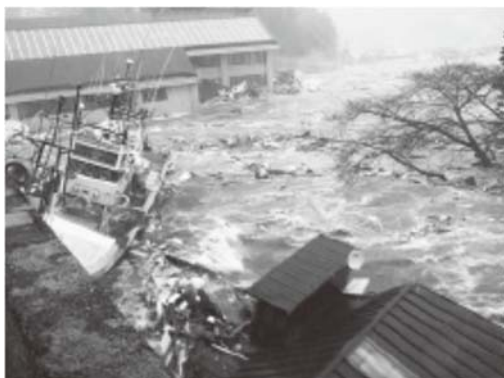
役場庁舎に激突する漁船

首長からは災害対策本部からの指示を待つことがなく、各々の担当部署で自ら考え、住民の不安を一つでも解消できるよう積極的な行動を行うよう指示されましたが、最初の 3 日間、1 週間は不眠不休で対応に従事しましたが、あまり膨大な数の課題があり、マンパワー不足を痛切に感じました。