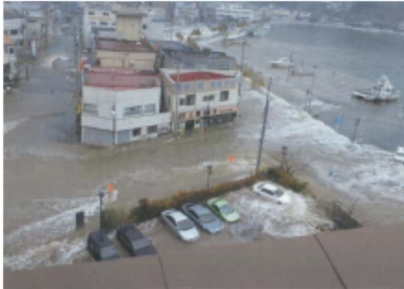
押し寄せる波が湾から溢れ、市街地を襲う