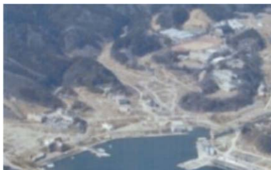
【震災後の女川町中心街】