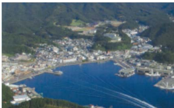
【震災前の女川町中心街】