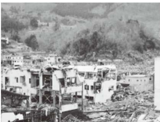
町中心部の RC 建物