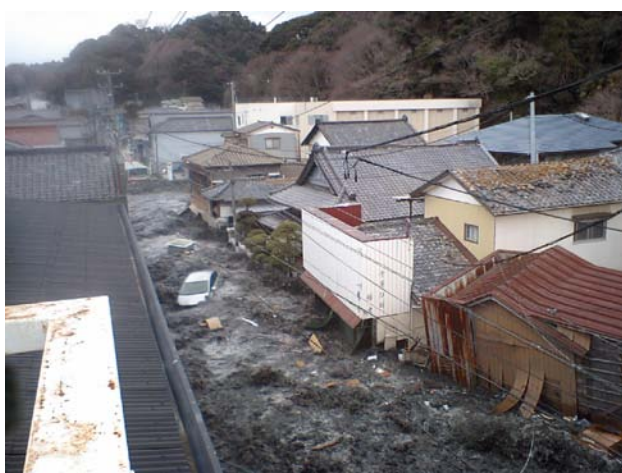
住宅地の道路に流れ込む津波