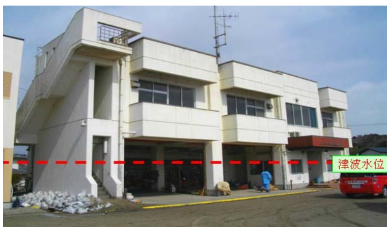
平消防署四倉分署の被害状況

さらに、ちょうど1か月後の4月11日、そして12日には市内の活断層を震源とする震度6弱の直下型の地震が発生し、沿岸部のみならず内陸部においても大きな被害を被ることとなった。