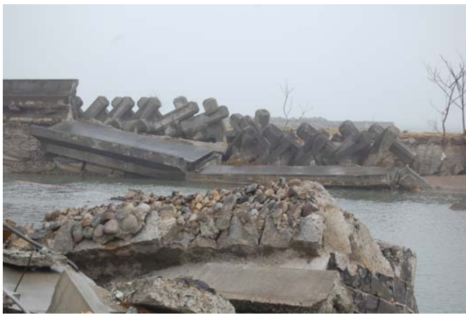
磯浜漁港、津波により防潮堤・防波堤が破壊されている