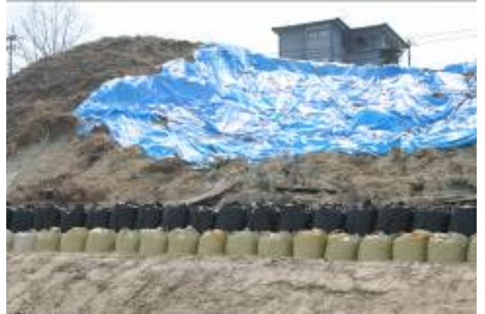
高瀬地区：ニュータウン入り口、山元分署から南約 2km