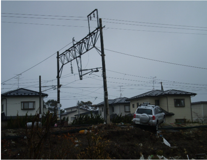
山下駅周辺、山元分署から海側約 2km の地点 山下駅ホームに車がある