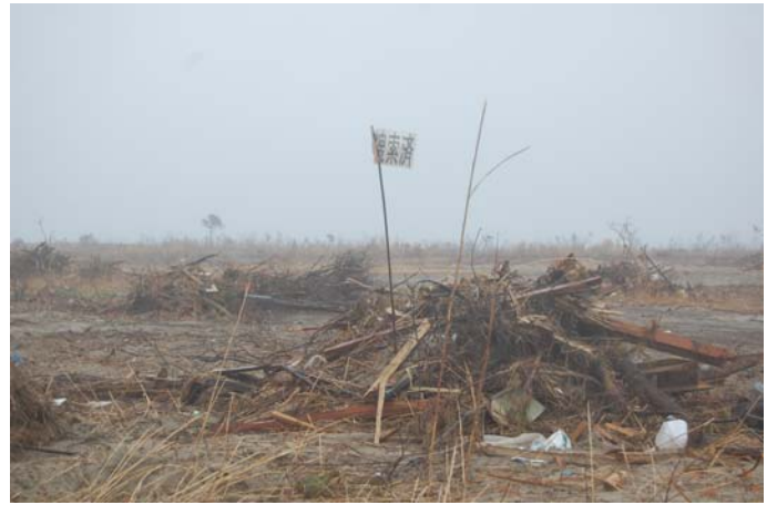
坂元地区、瓦礫には「搜索済」の旗が立てられている