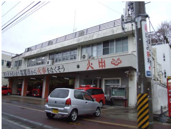
前面道路から車庫を望む