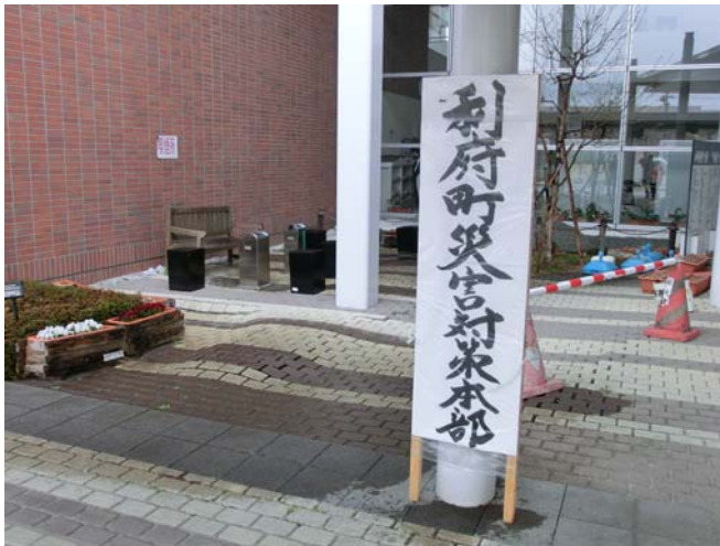
利府町役場入り口付近 ブロックが歪んでいる