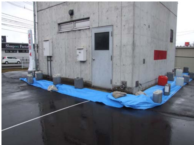
訓練塔周囲の地盤沈下