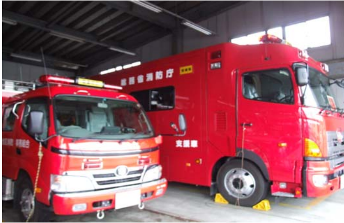
車庫内の消防車（右は総務省所属車両）