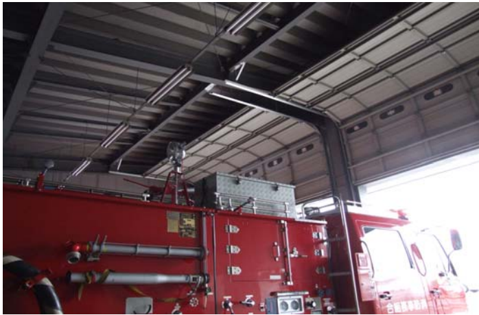
レール変形により開扉支障したシャッター