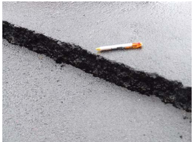
庁舎敷地内の亀裂・段差