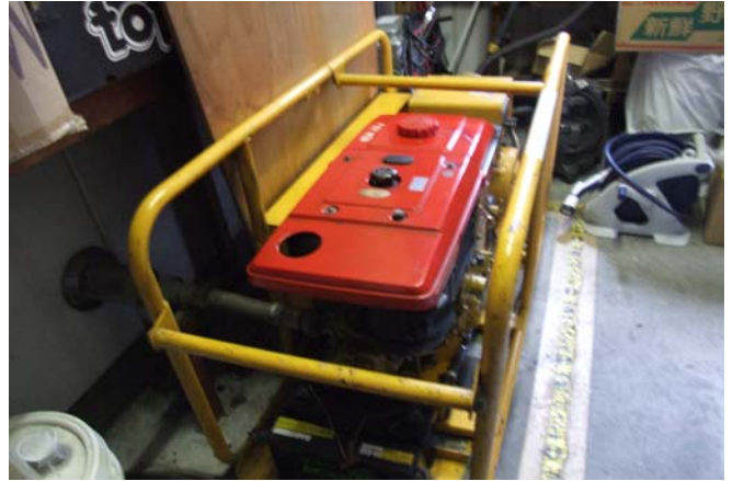
庁舎非常電源設備