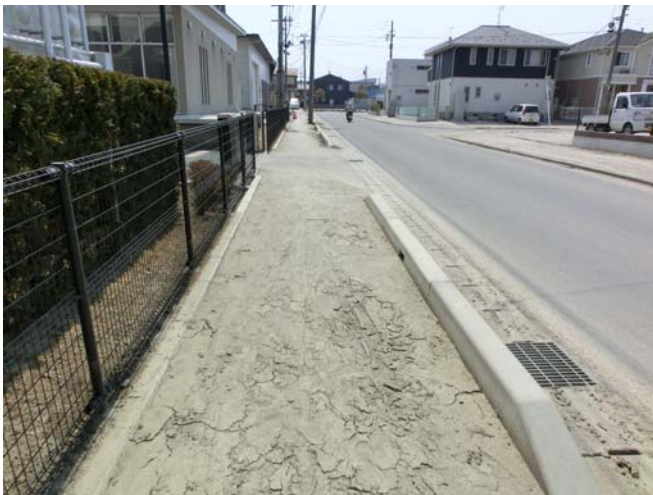
周辺道路の津波遡上の痕跡 建物被害は見られない