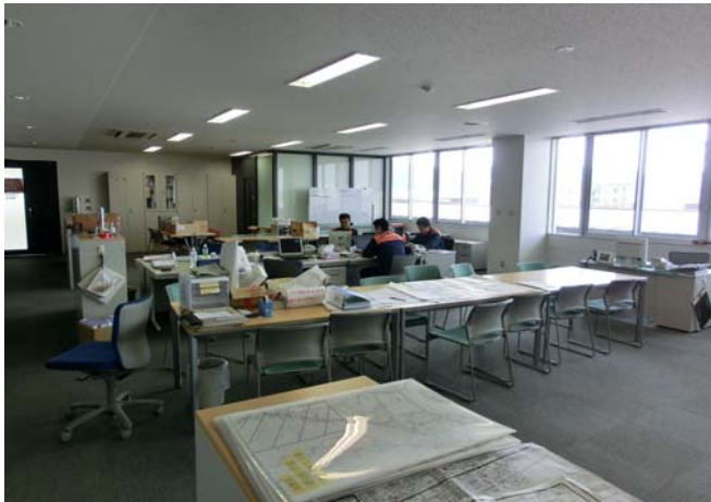
石巻消防署内の活動の様子 (1)