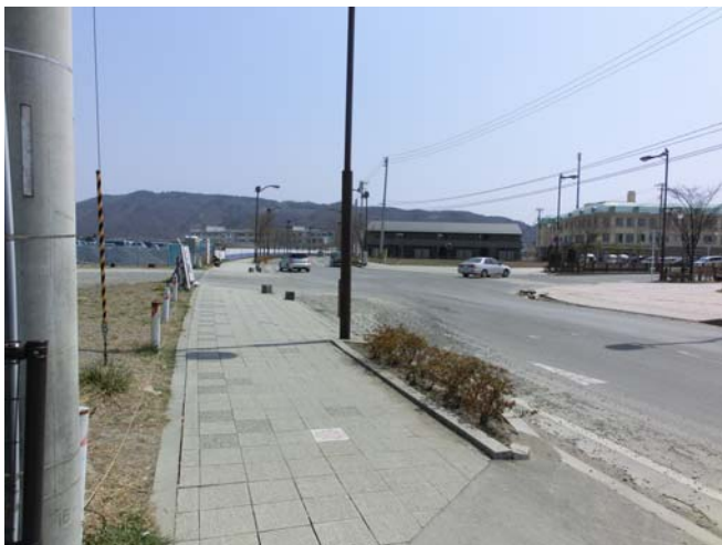
庁舎前道路 左側広場にボランティアテント村