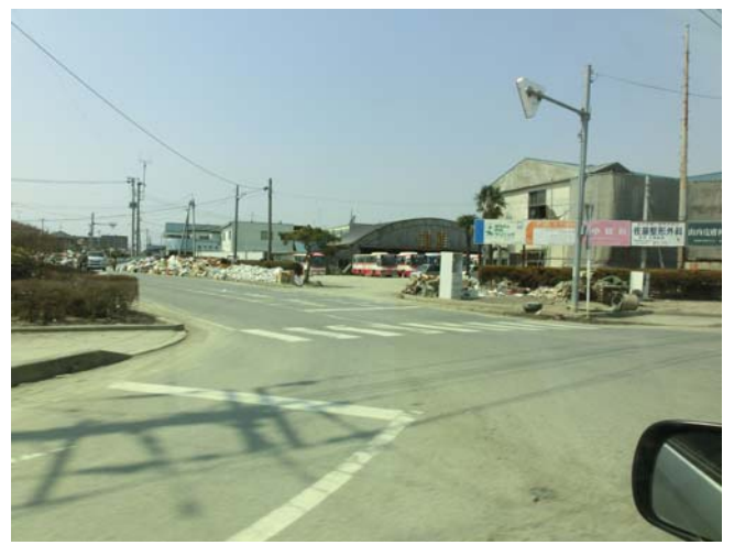
周辺区域の至る所で津波の痕跡がみられた