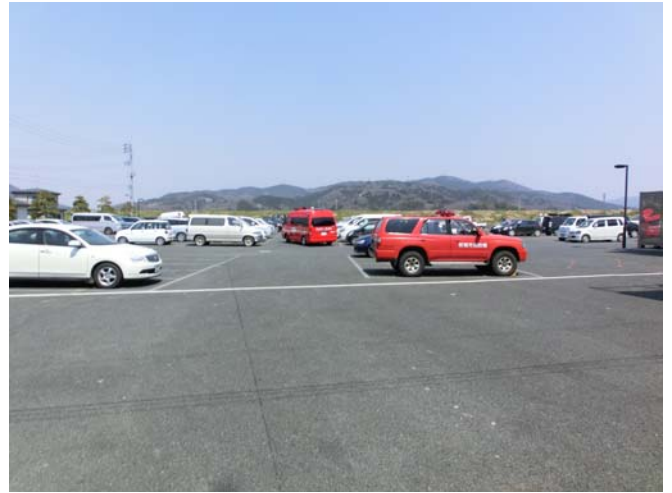
消防本部駐車場 各地から消防車両が集結していた