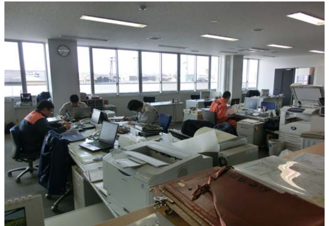
消防署内の活動の様子 (2)