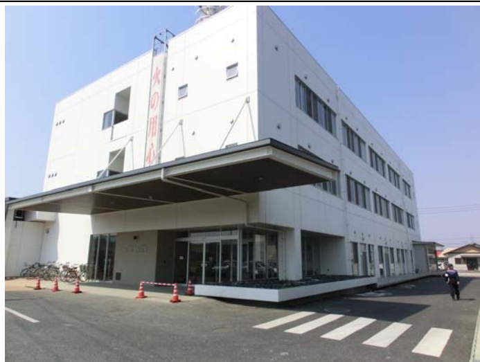
本部庁舎全景玄関 1階に消防署がある 被害は見受けられなかった