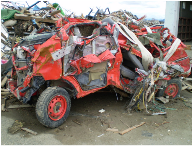
津波により破損した消防車両、団車両か？