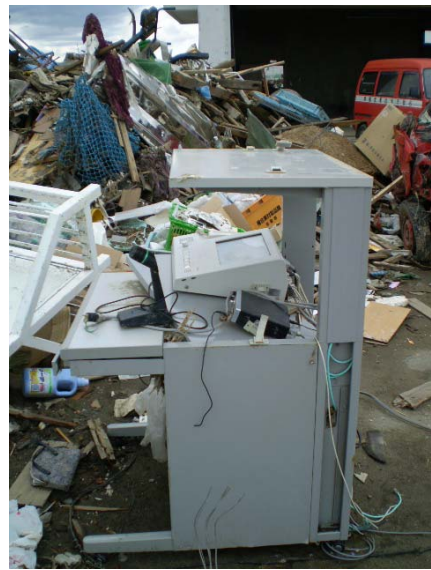
津波により破損した受令台