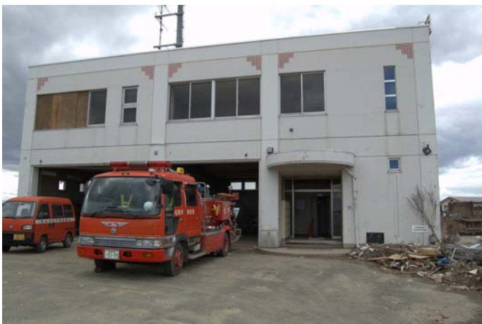
庁舎前に停められた消防車両、活動状況は不明。