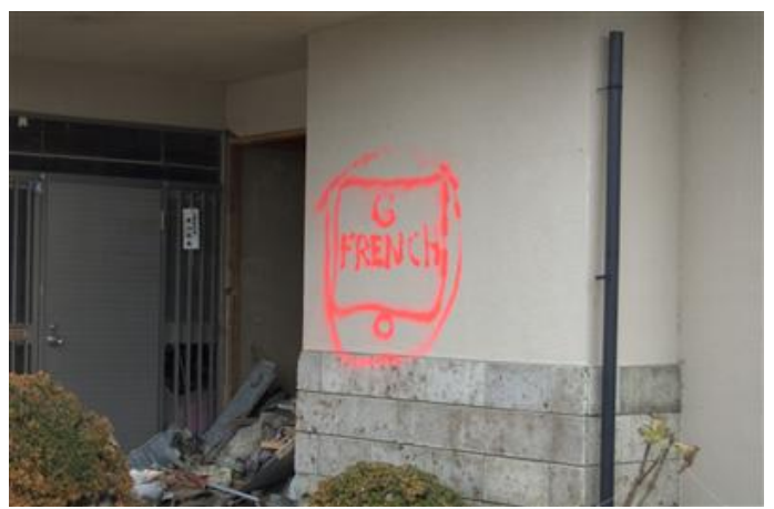
フランス隊による検索済みのマークと思われる