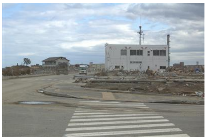
庁舎背面(陸側)から見た全景、周囲の建物は消失