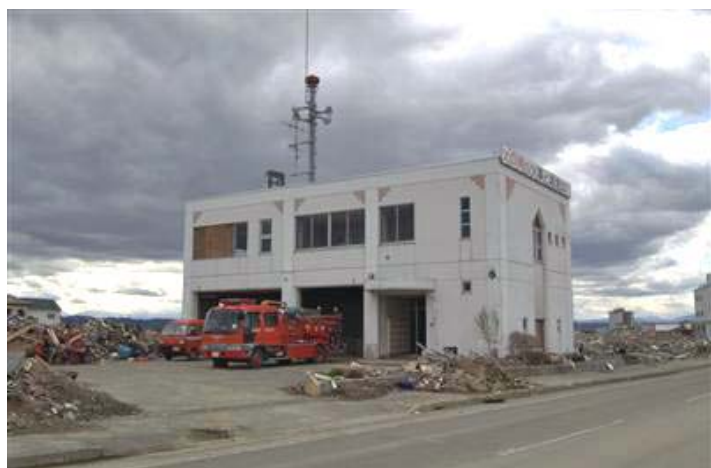
庁舎正面(海側)から見た全景