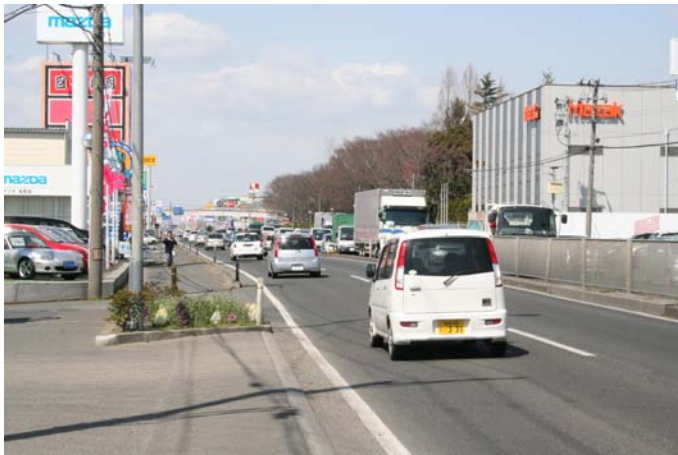
庁舎前から国道 4 号線北方向を見た様子