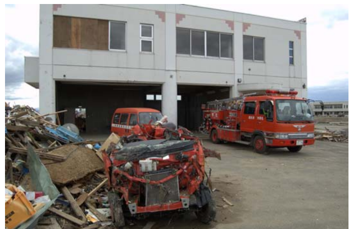
（被災した関上出張所の様子 4/20 時点）

・名取市消防署は沿岸から 6 km ほど内陸部にあり、周辺地域も含めて津波による浸水被害はなかったが、沿岸部の関上（ゆりあげ）出張所は周辺地域一帯が浸水被害を受けていた。