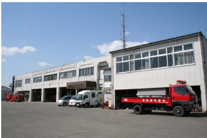
南側から見た庁舎全景