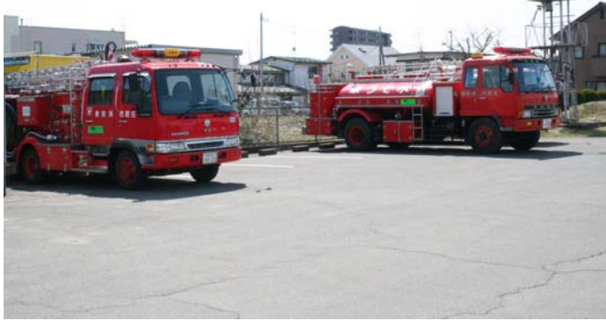
消防車両（はしご車及び水槽車）