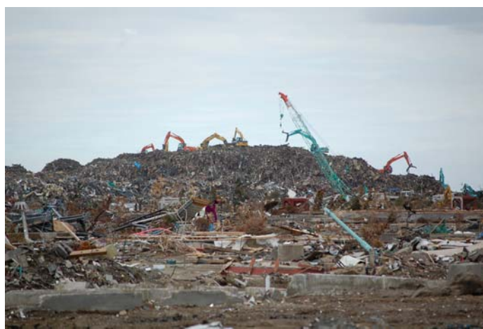
名取川河口付近（関上地区）の瓦礫の仮置き場