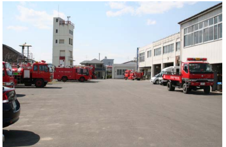
東側から見た庁舎全景