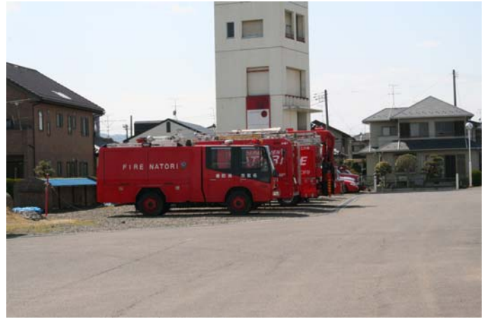
消防車両（はしご車他）