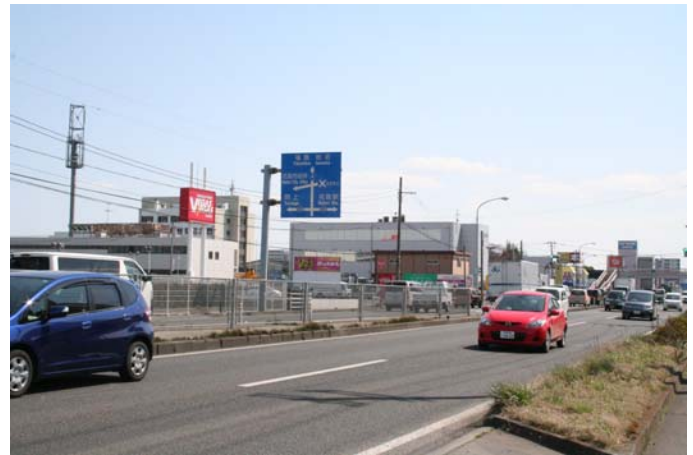
庁舎前から国道 4 号線南方向を見た様子