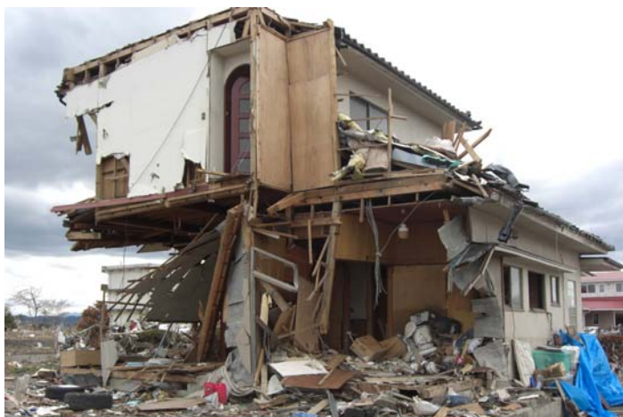
名取川河口付近（関上地区）の被害