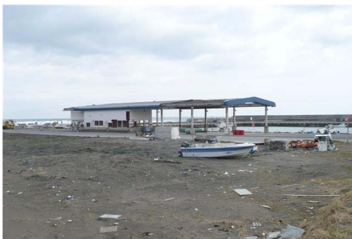
種市漁港の漁港施設