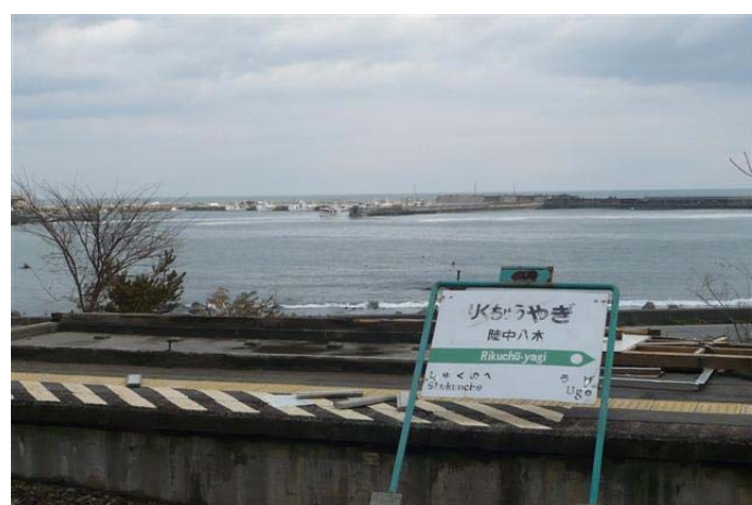
被害を受けた陸中八木駅