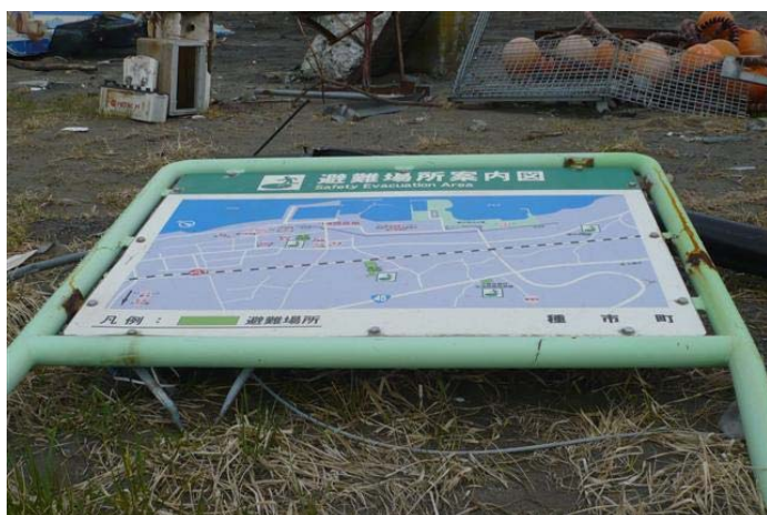
なぎ倒された避難案内図（種市漁港）