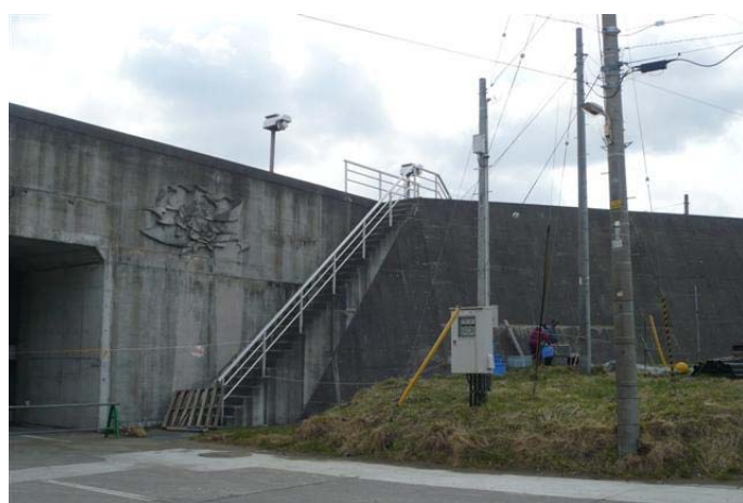
種市漁港付近の防潮堤