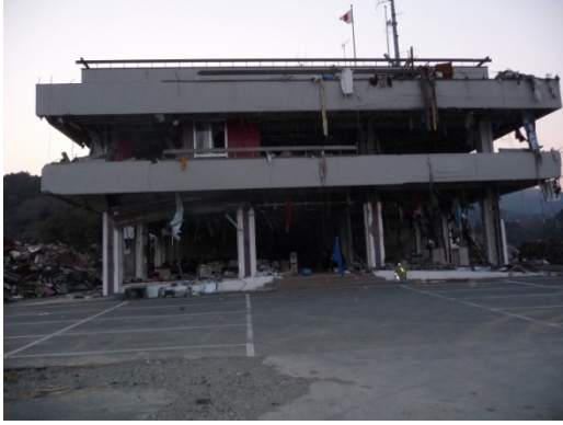
女川町役場全景 1 (玄関付近に町旗がはためく)