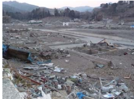
女川町役場から見た周囲の様子