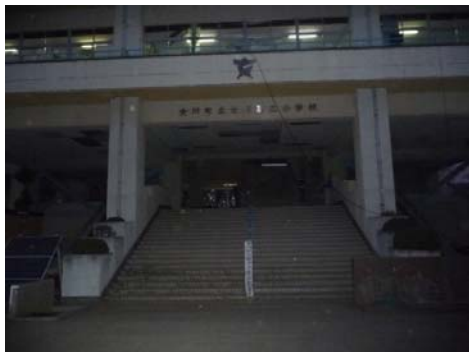
女川第二小学校正面玄関