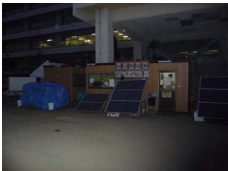
小学校前に設置されたボランティアセンター