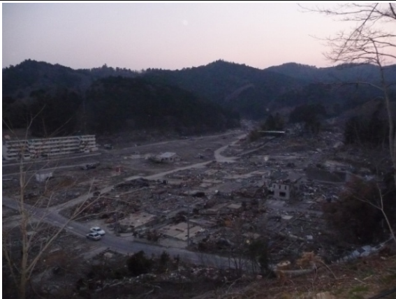
女川第一中学校から見た被害の様子 1