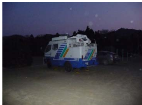
小学校前に駐車されている衛星通信車