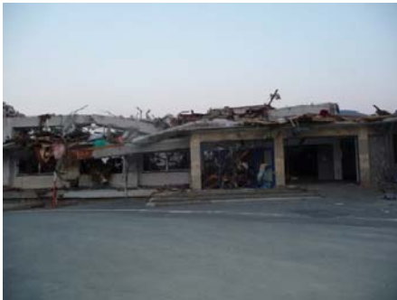
女川町役場前の公民館