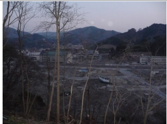
女川第一中学校から見た被害の様子 2