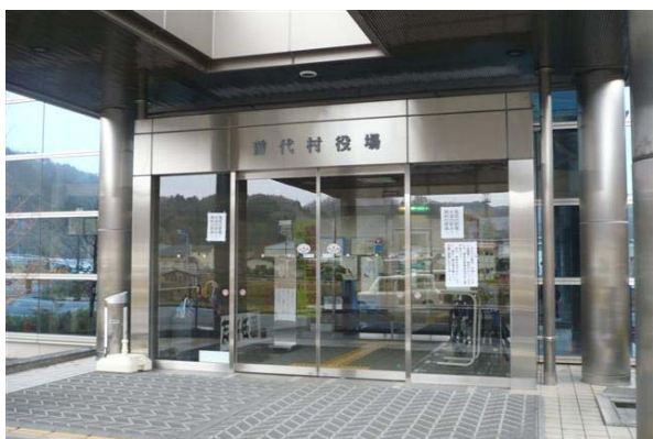
普代村役場の玄関