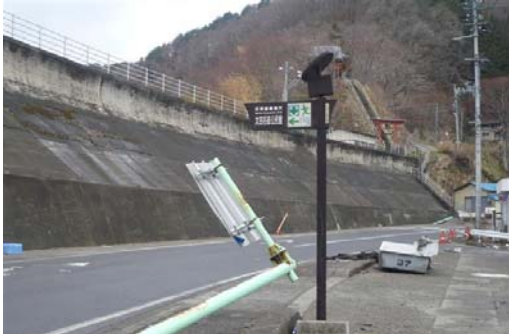
* 太田名部地区への津波の浸入をくい止めた防潮堤・防波 堤（昭和 42 年完成 15.5m） * 奥の方に見えるのは防潮堤からさらに上に上がる階段。