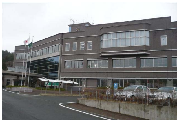
普代村役場の全景