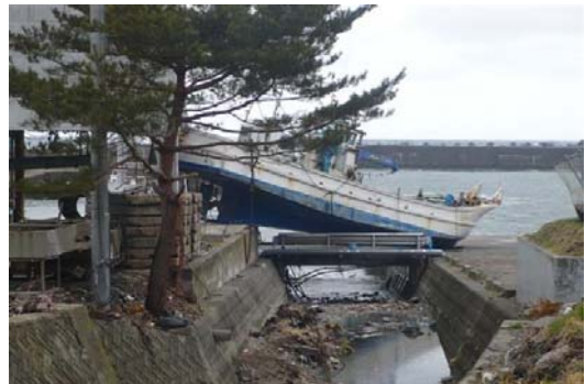
打ち上げられた漁船（太田名部漁港）