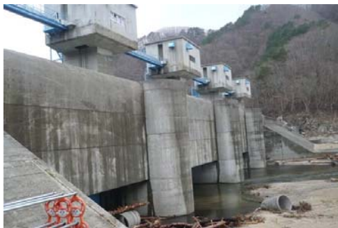
* 村中心部への津波の浸入を最小限に食い止めた 普代水門（昭和 59 年完成 15.5m）