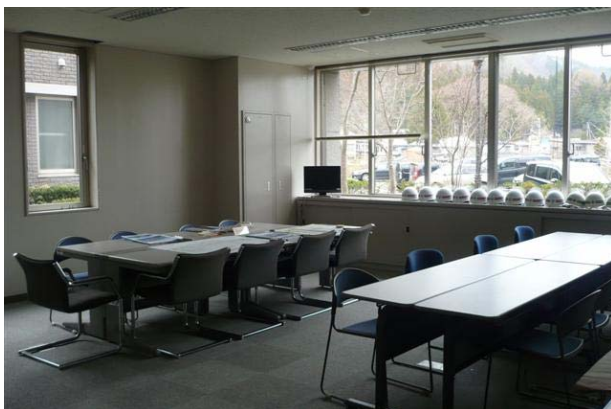
災害対策本部室内の様子