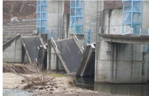
* 津波は水門を超え、水門に被害を与えたが、村中心部ま での浸入はなかった（写真は水門の内陸側）