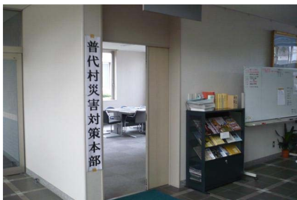
災害対策本部の掲示