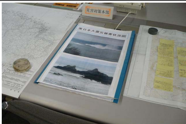
災害対策本部室に置かれていた被害地図