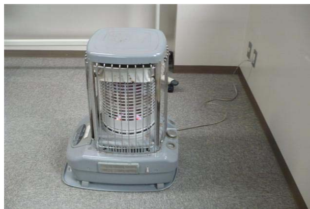
災害対策本部室に置かれていたストーブ