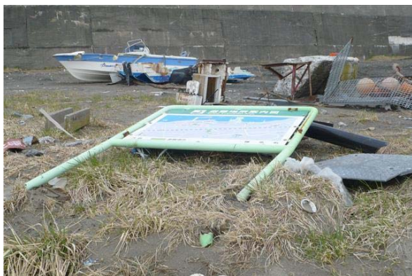
種市漁港付近（津波避難看板もなぎ倒されている）