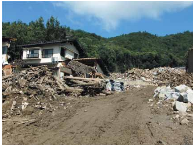
山裾まで住宅地が開発された広島市八木地区の被害

近、かつてはなかったような猛烈な雨が各地で降るようになり、大きな土砂災害が目立つようになった。今後、私たちはどう土砂災害に備えたらいいのだろうか。以下に、広島市の豪雨災害を受けて、何が問題だったのかを明らかにしながら、残されている課題は何かを考えていきたい。