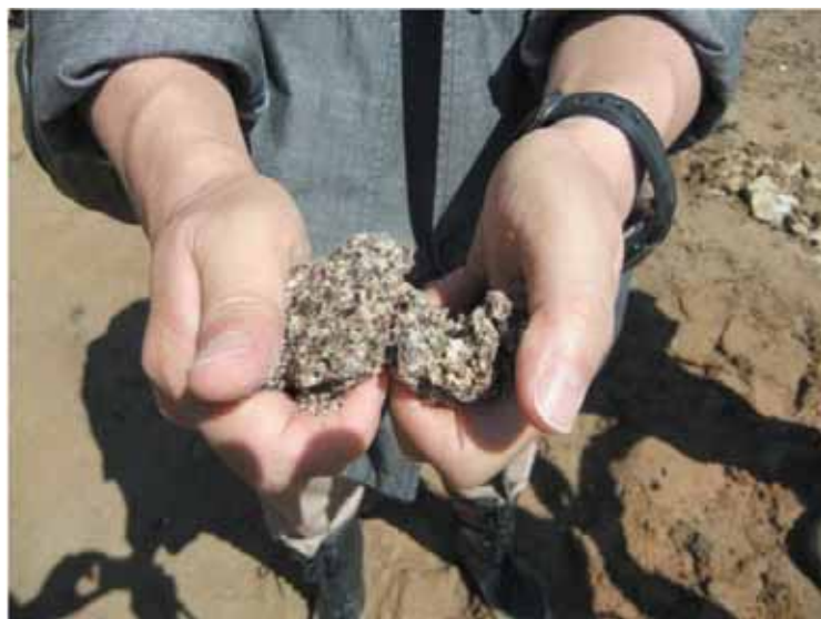
手ですぐに割れる 広島市の「真砂土（まさど）」

土」の表面は水がしみ込みやすい砂の層で、大量の雨によって層全体が重くなり、岩盤の上を一気に崩れ落ちる「表層崩壊」が起きたとみられる。