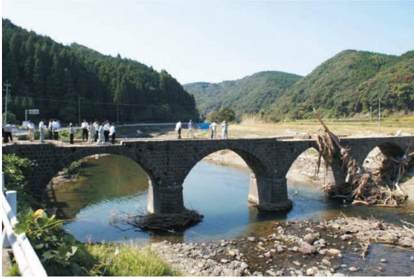
写真2 石橋の被災状況（星野川宮ヶ原橋（4連眼鏡橋）。平成24年10月16日撮影）

花月川については、7月3日に国直轄区間の5k800左岸と6k200右岸の2カ所において決壊が発生した。水衝部に強い流れが当たり堤防前面基礎部分に洗堀が生じ決壊に至ったと考えられている。矢部川支川の沖端川（福岡県管理）では、12k200地点右岸と13k400地点左岸において越水により決壊した。黒川（熊本県管理）では、下流端から15.8km、20.6km位置の左岸側がそれぞれ決壊している。