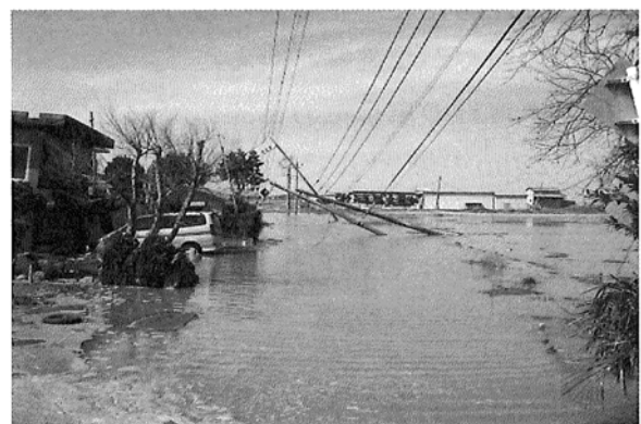
写真3 利根川沿岸の旧沼地の被害、左端の