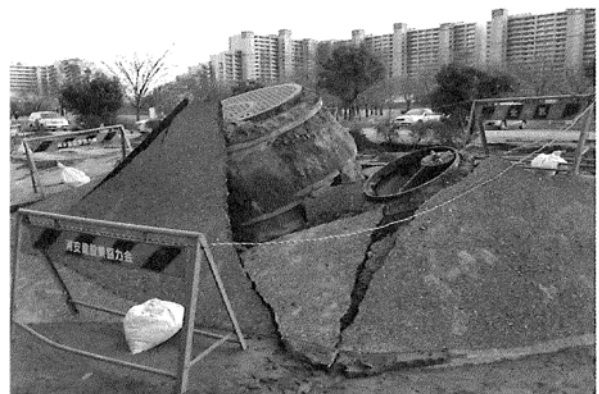
写真2 耐震性貯水槽の浮き上がり