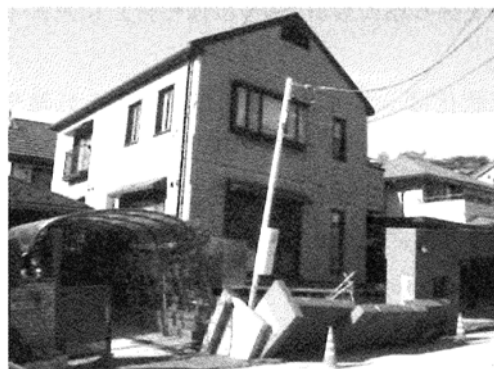
写真 1 浦安市における住宅被害 3)